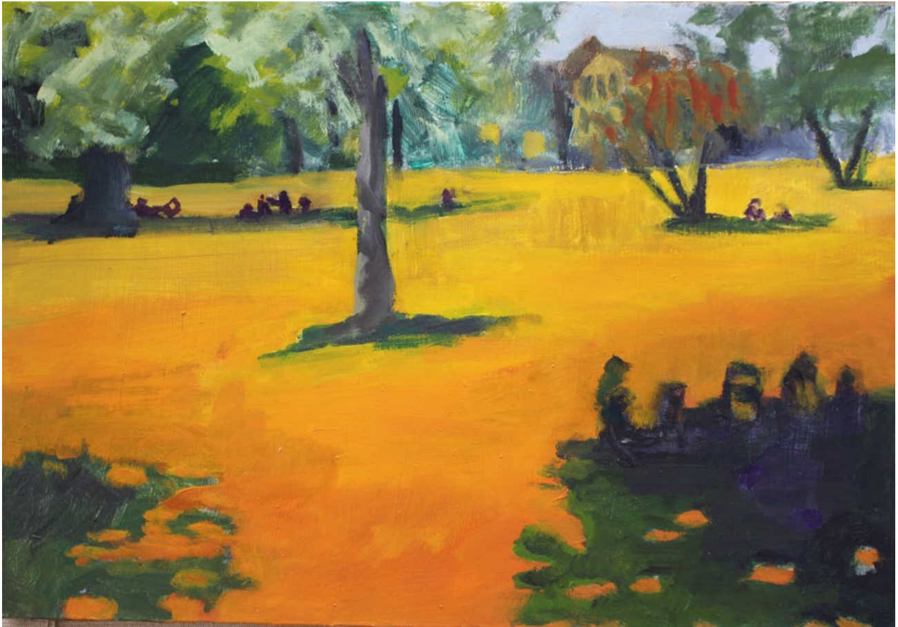
Bäckeranlage – Öl auf Karton – 21×30 cm – 2018