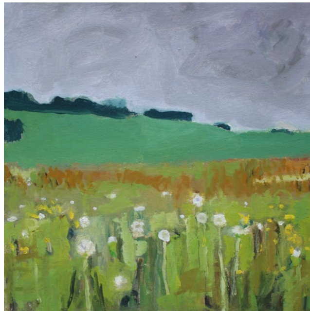
o.T. – Öl auf Karton – 24x24 cm – 2018