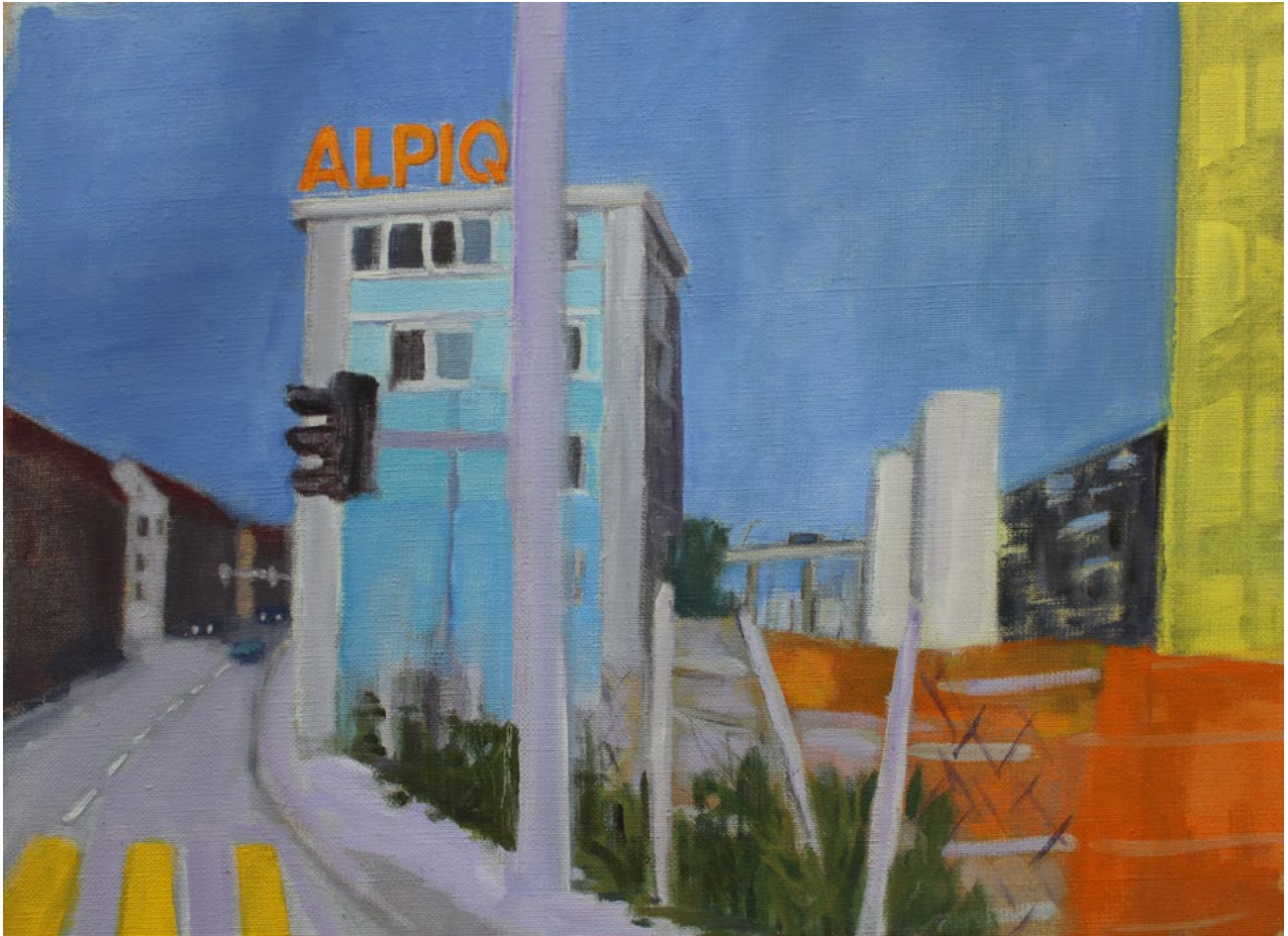
o.T. – Öl auf Leinwand – 30x40 cm – 2018