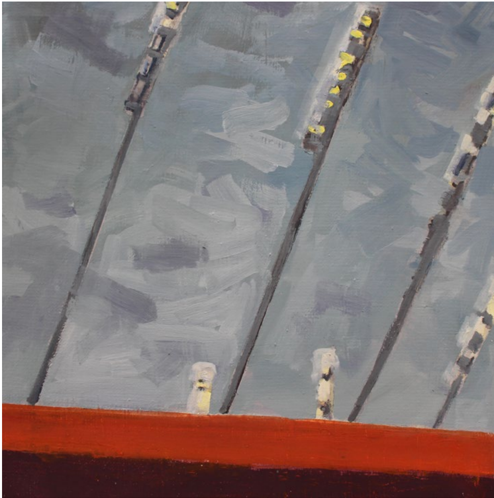
o.T. – Öl auf Leinwand – 30x30 cm – 2018