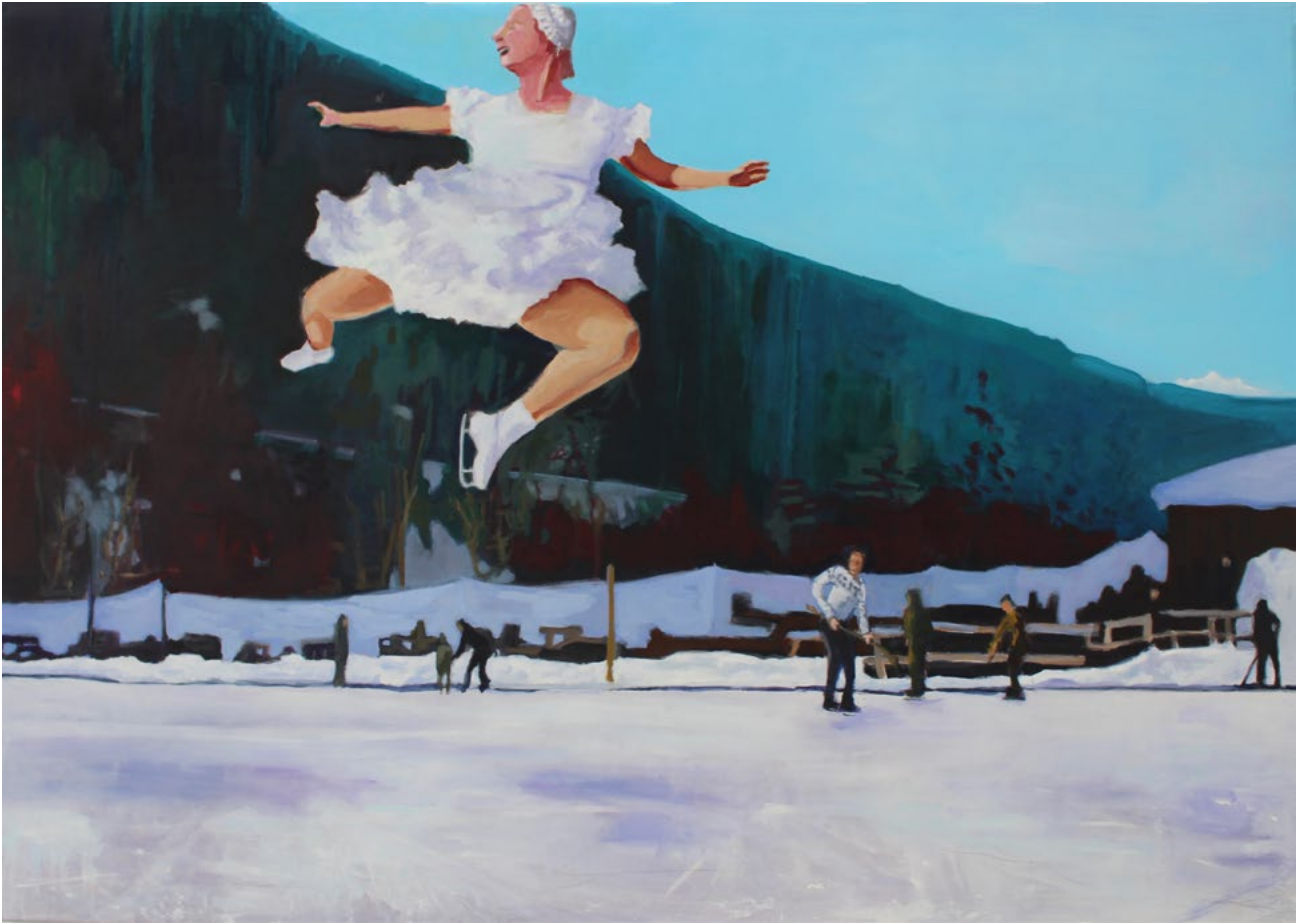
Hochhinaus – Öl auf Leinwand – 84×120 cm – 2018