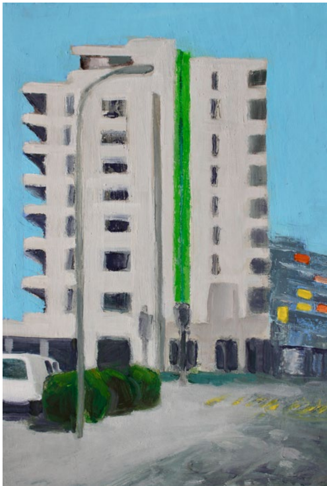
Grünau – Öl auf Karton – 30×21 cm – 2018