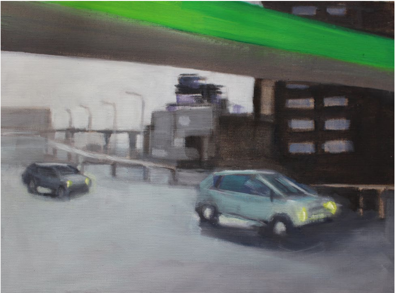
o.T. – Öl auf Leinwand – 30x40cm – 2018