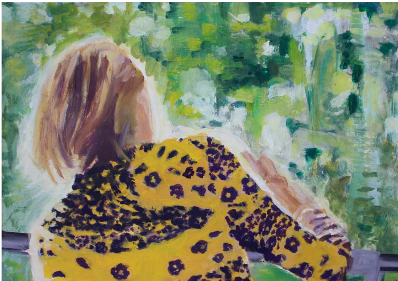
Im Zug - Öl auf Karton - 21×30 cm - 2018