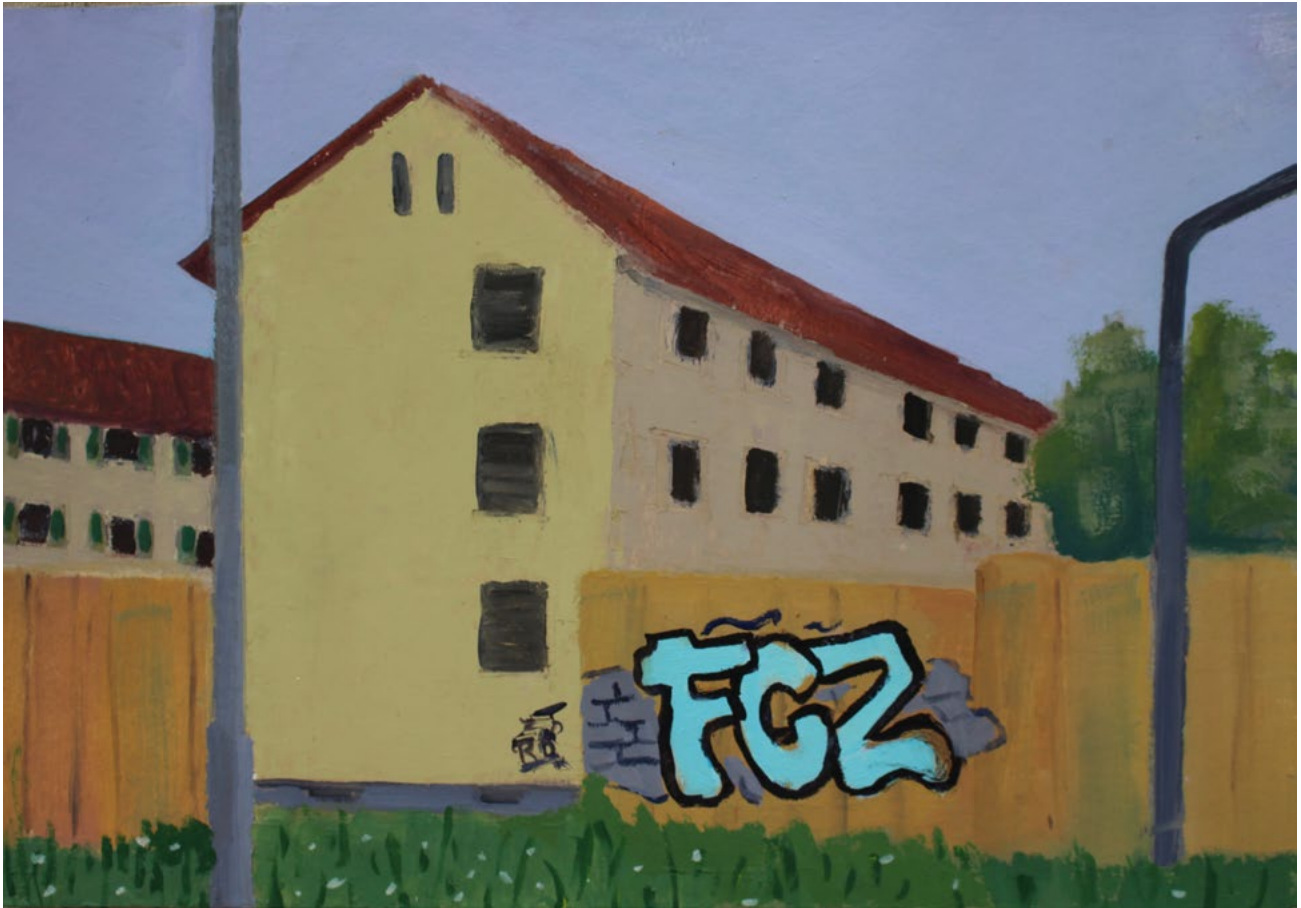
Schwamendingen – Öl auf Karton – 21×30 cm – 2018