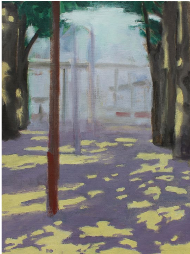
o.T. - Öl auf Leinwand - 40x30cm - 2018