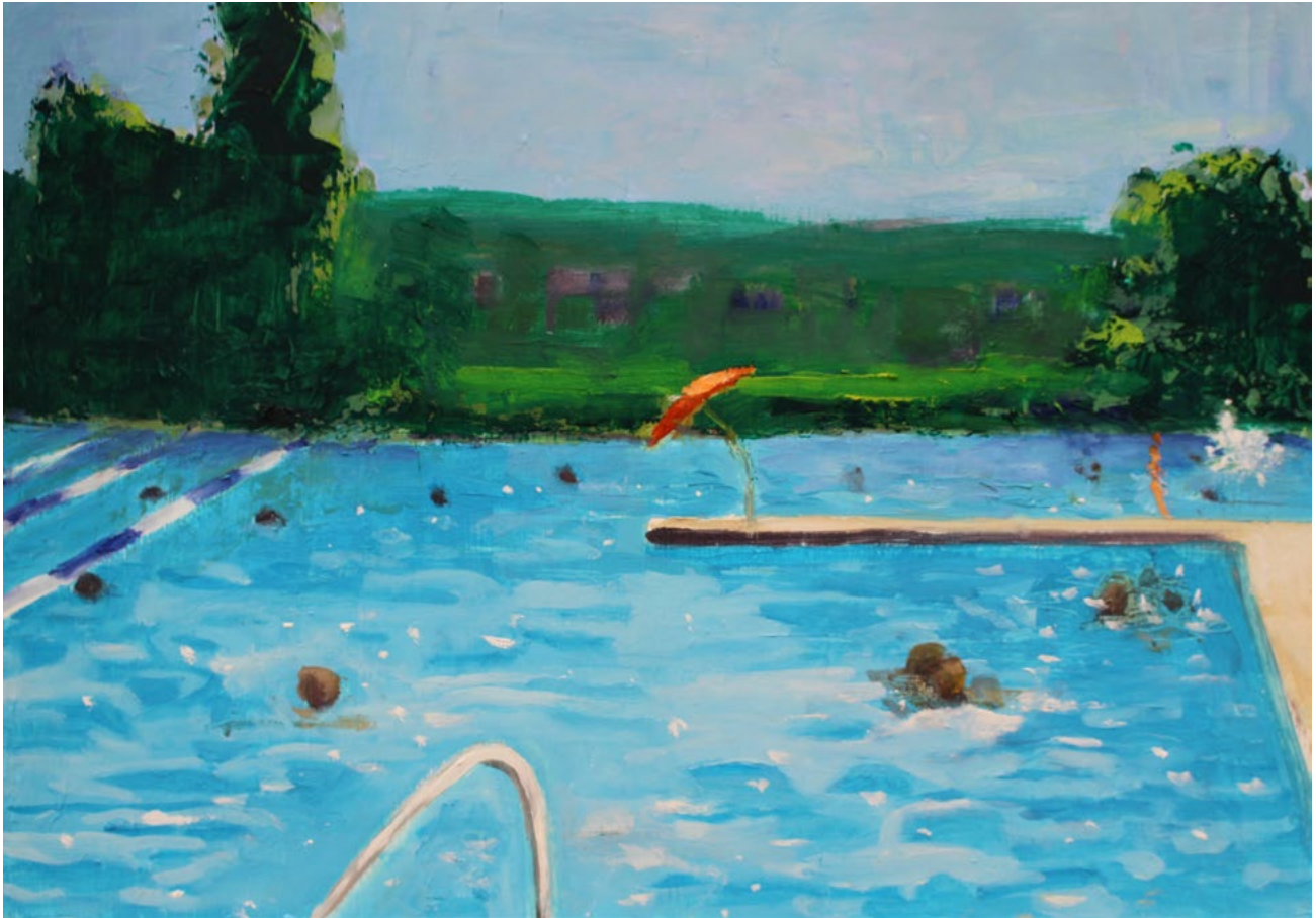
Letzi Badi - Öl auf Karton - 21×30 cm - 2018