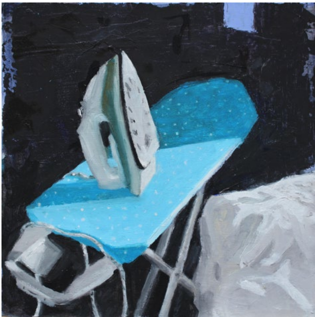
Bügelbrett – Öl auf Karton – 24x24 cm – 2018