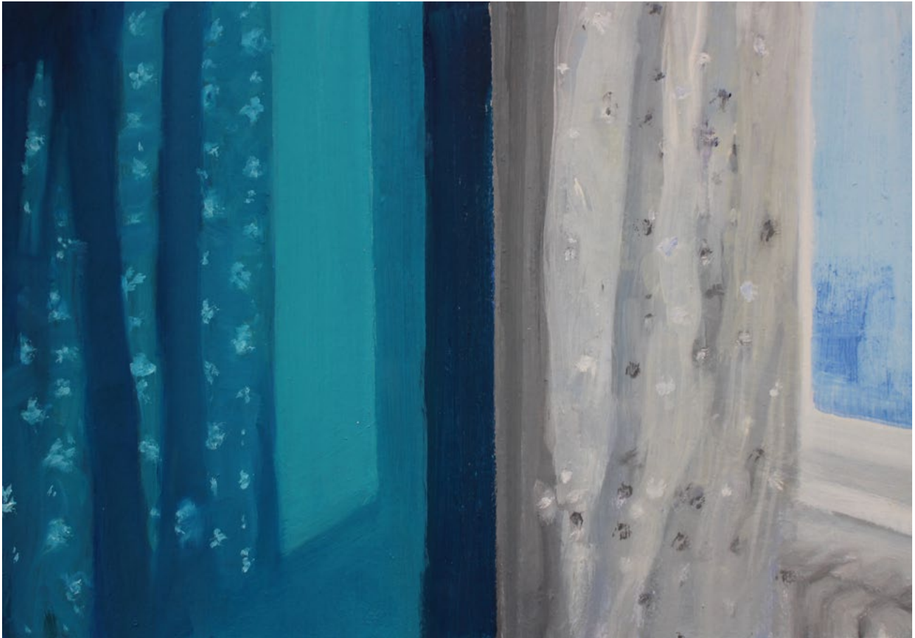
Morgenlicht – Öl auf Karton – 21×30 cm – 2018