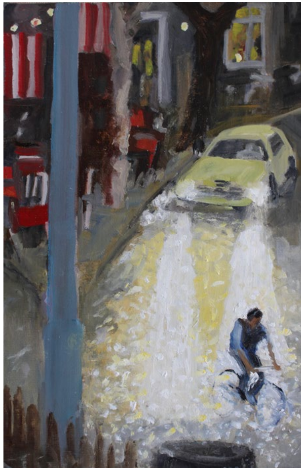
Kurve Schönegg-Feldstrasse – Öl auf Karton – 30×20 cm – 2017