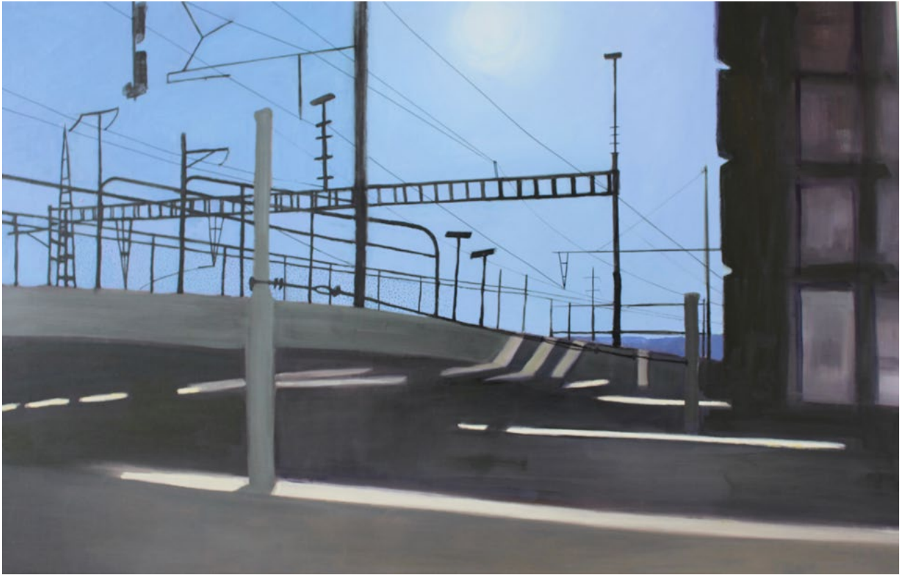
o.T. – Öl auf Leinwand – 63×98 cm – 2018