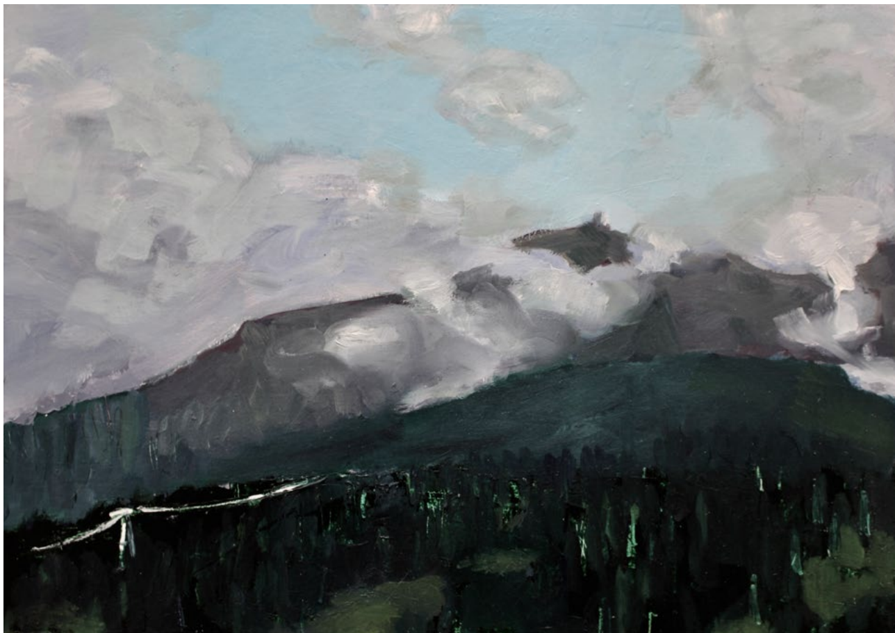
Gotschna – Öl auf Karton – 21×30cm – 2018