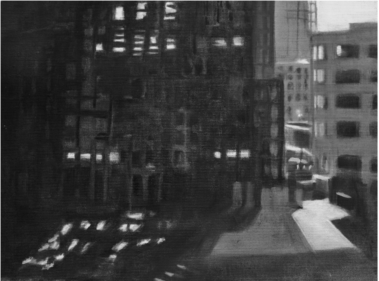
o.T. - Öl auf Leinwand - 30x40cm - 2018