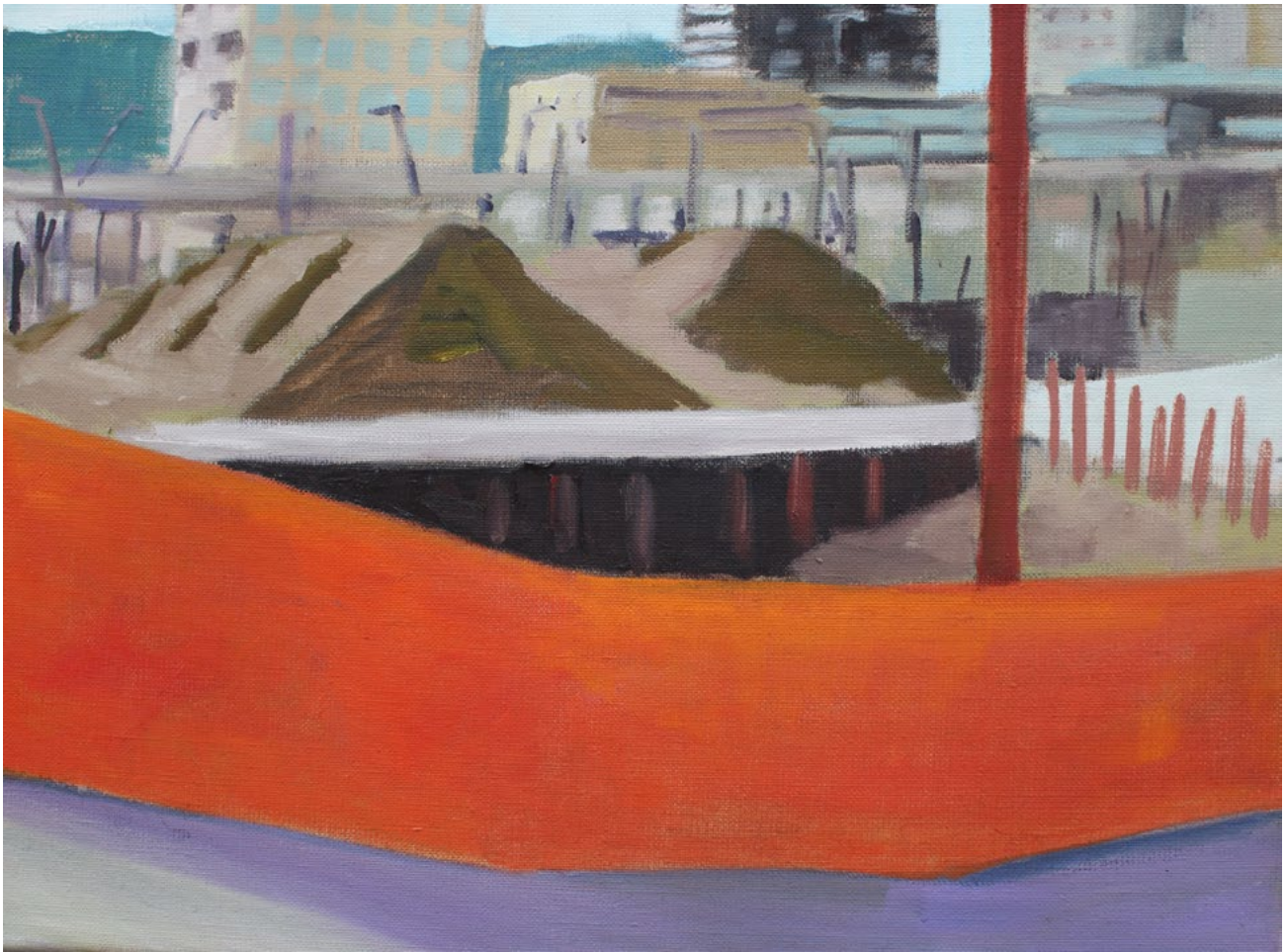
o.T. – Öl auf Leinwand – 30x40cm – 2018