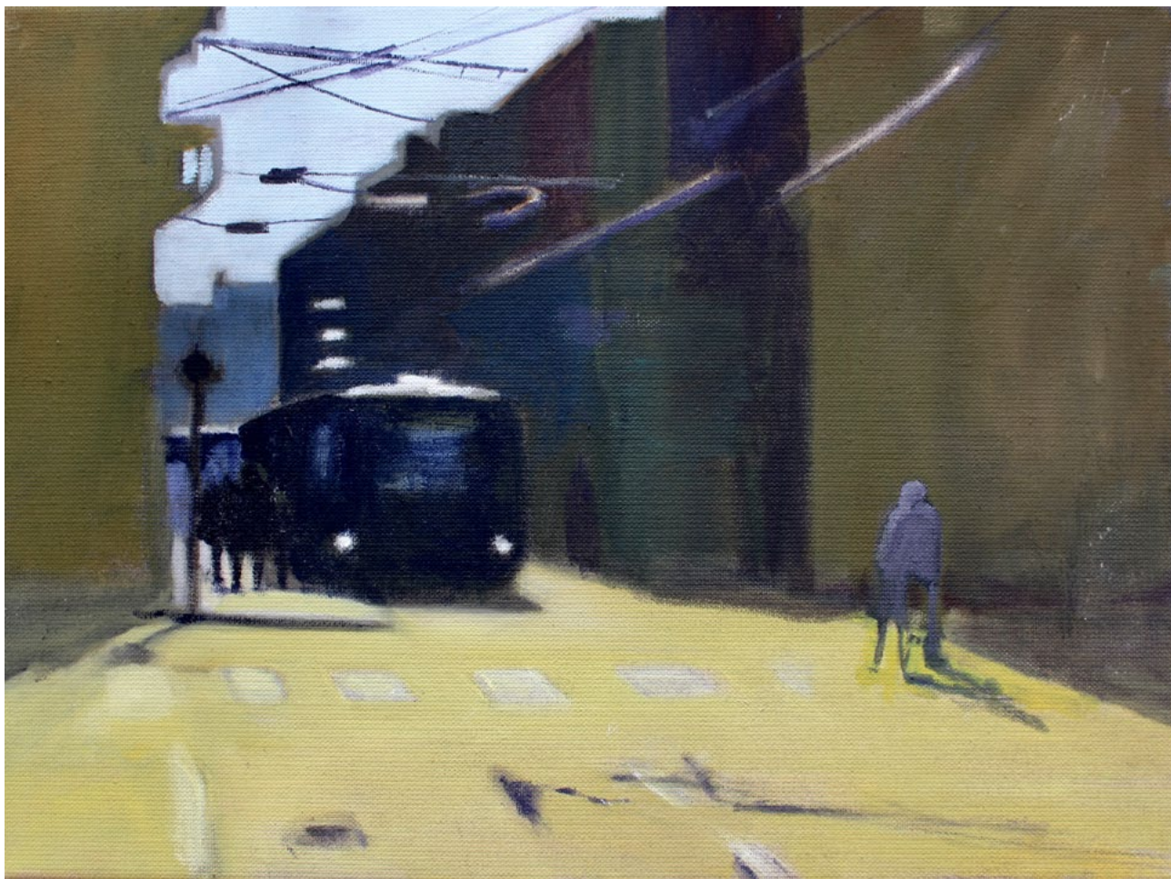
o.T. – Öl auf Leinwand – 30x40cm – 2018