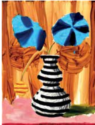
19 Golden times. Öl auf Leinwand, 40x30 cm, 2021