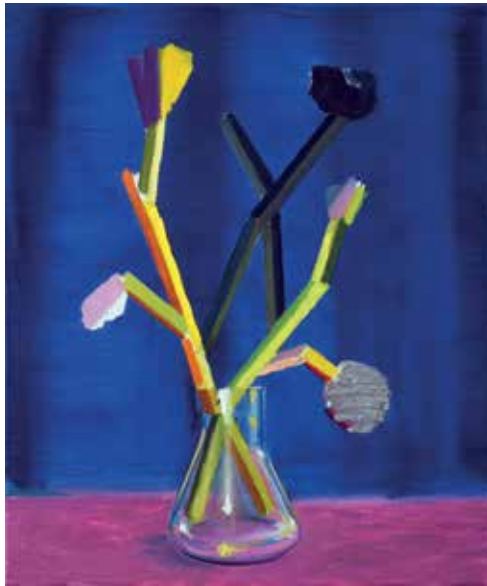
11 Domestic pleasures #9. Öl auf Leinwand, 60x50 cm, 2021