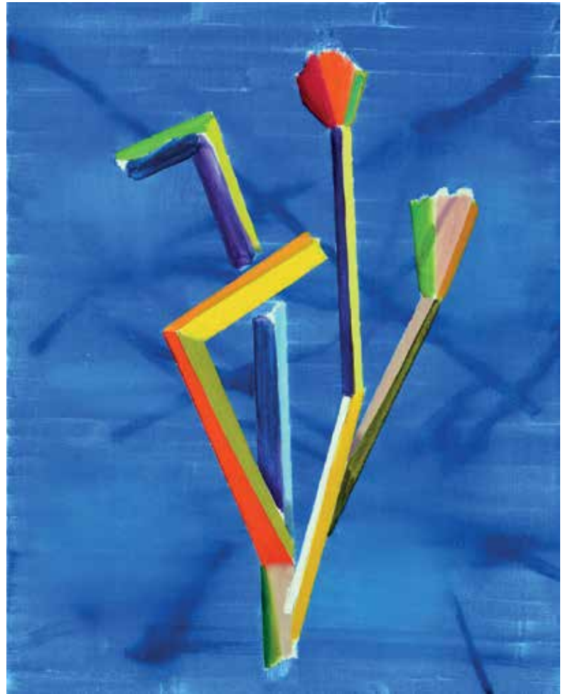
09 Diatribe. Öl auf Leinwand, 100x80 cm, 2021