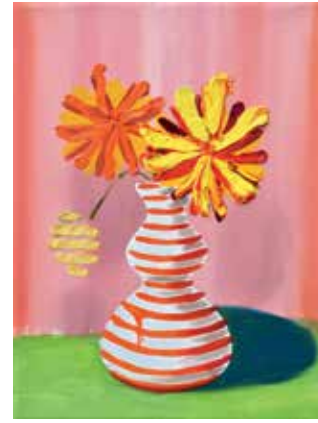
14 Pim !. Öl auf Leinwand, 40x30 cm, 2021 Pam !. Öl auf Leinwand, 40x30 cm, 2021 Poum !. Öl auf Leinwand, 40x30 cm, 202