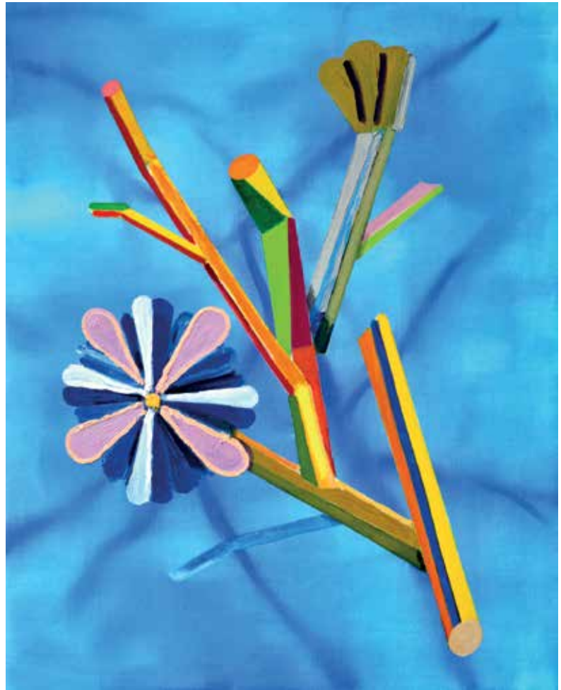
02 Flirt, Öl auf leinwand, 100x80 cm, 2021 03