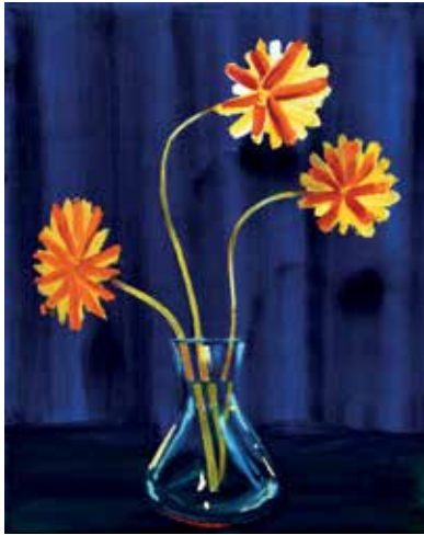
06 Rote Linie. Öl auf Leinwand, 50x40 cm, 2021