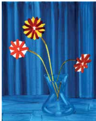
10 Charme discret #I. Öl auf Leinwand, 50x40 cm, 2021 Charme discret #II. Öl auf Leinwand, 50x40 cm, 2021