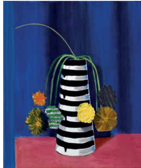
08 Domestic pleasures #8. Öl auf Leinwand, 60x50 cm, 2021 Domestic pleasures #7. Öl auf Leinwand, 60x50 cm, 2021