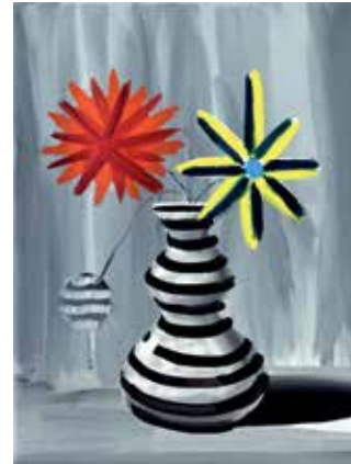
18 Fiesta I. Öl auf Leinwand, 40x30 cm, 2021 Golden days , Öl auf Leinwand, 40x30 cm, 2021 Fiesta II. Öl auf Leinwand, 40x30 cm, 2021