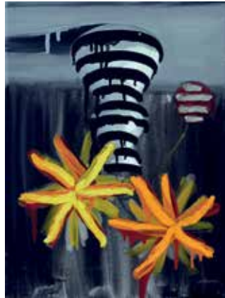
20 Chez Georg. Öl auf Leinwand, 40x30 cm, 2021