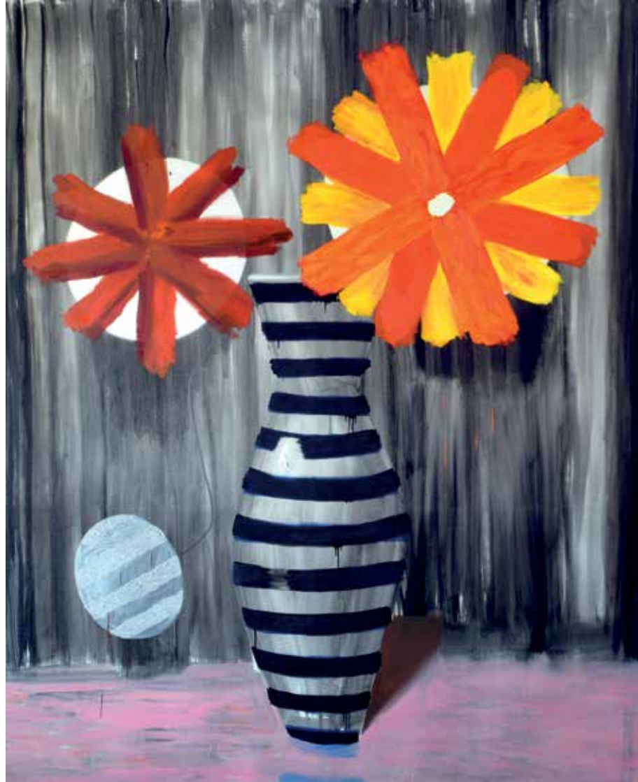
21 Left side. Öl auf Leinwand, 230x180 cm, 2021