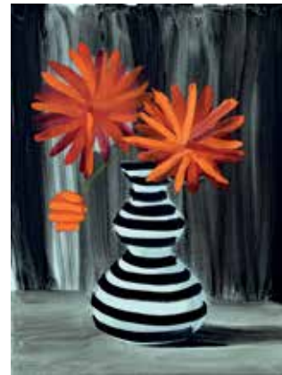
13 Jeux floraux #13. Öl auf Leinwand, 40x30 cm, 2021 Negro y plata. Öl auf Leinwand, 40x30 cm, 2021 Jeux floraux #5. Öl auf Leinwand, 40x30 cm, 2021