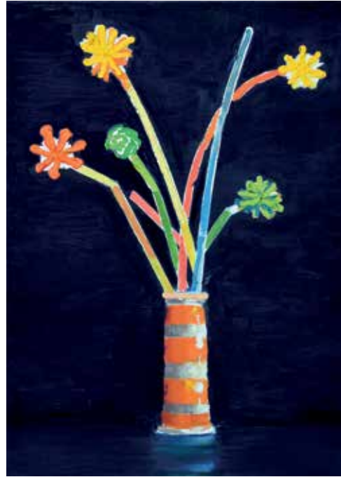
07 Schön dich zu sehen. Öl auf Leinwand, 70x50 cm, 2021 Kunstblumen. Öl auf Leinwand, 70x50 cm, 2021