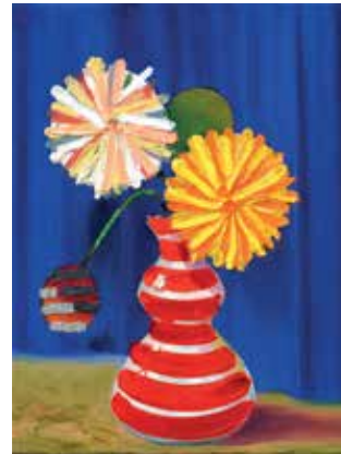
16 Jeux floraux #8. Öl auf Leinwand, 40x30 cm, 2021 / Jeux floraux #12 Öl auf Leinwand, 40x30 cm, 2021 / Jeux floraux #10. Öl auf Leinwand, 40x30 cm, 2021 Jeux floraux #1. Öl auf Leinwand, 40x30 cm, 2021 / Jeux floraux #11. Öl auf Leinwand, 40x30 cm, 2021 / Jeux floraux #2. Öl auf Leinwand, 40x30 cm, 2021