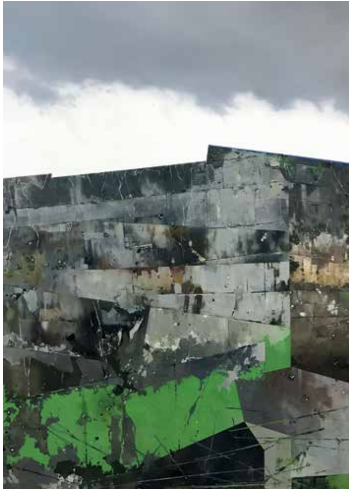
15 Carboniferus, Öl auf Leinwand, 70x50 cm, 2022