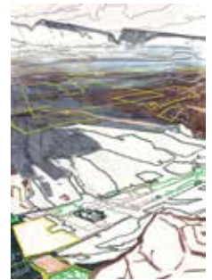
12 Studien und Skizzen, je 29x21 cm, Mischtechnik (Farbstifte, Bleistift, Öl, Marker auf Papier oder Leinwandstück), 2017–2024