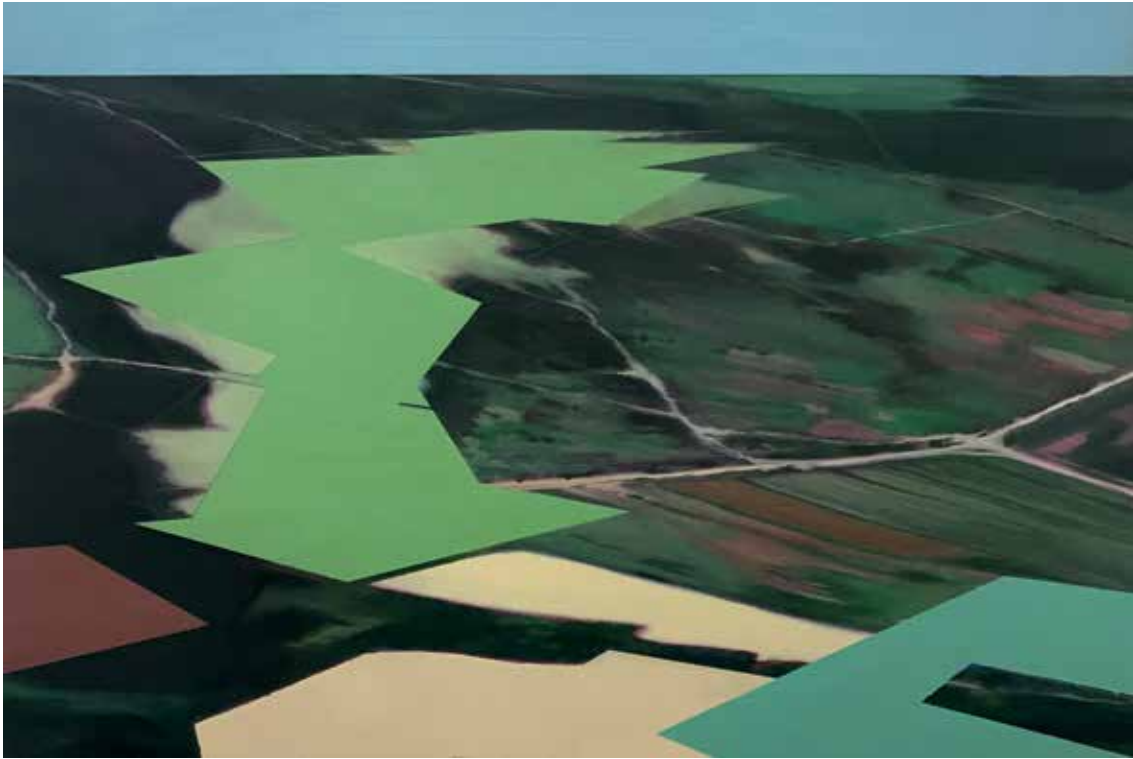
19 Vermessenheit, Öl auf Leinwand, 40x60 cm, 2023