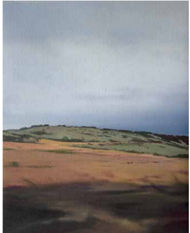
14 Roter Berg, Öl auf Leinwand, 30x24 cm, 2023 Rotes Moor, Öl auf Leinwand, 30x24 cm, 2023