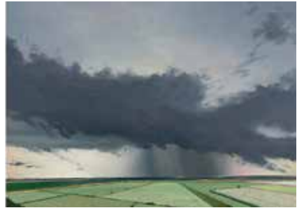
Grosser Bogen, Öl / Farbstift auf Papier, 21 x 29 cm, 2022