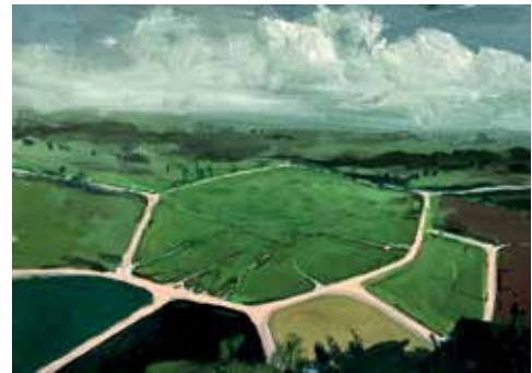
Studien aus der Serie «Barockflugplatz», je 29x21cm, Mischtechnik (Farbstifte, Öl, Marker auf Papier), 2024