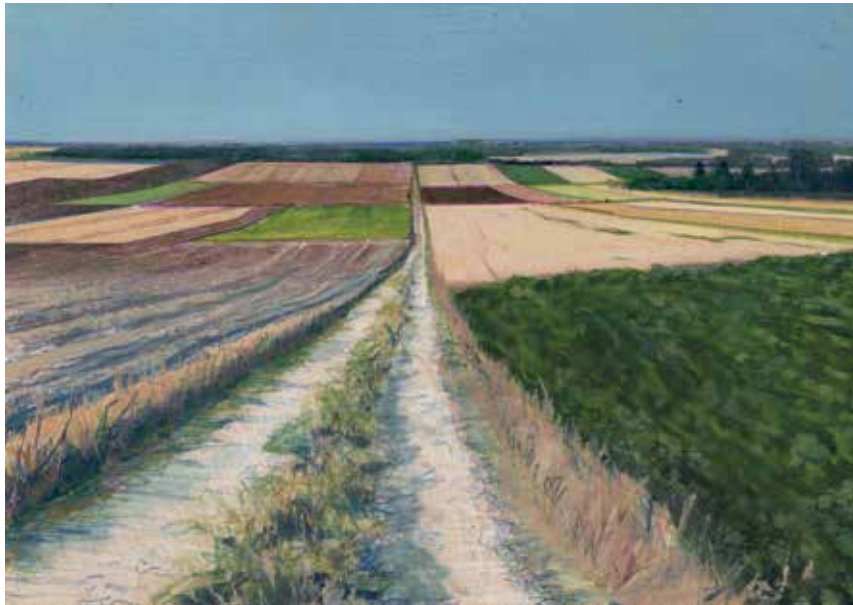
02 Landwirtschaftliche Geometrie, Öl/Farbstift auf Papier, 21 x 29 cm, 2023