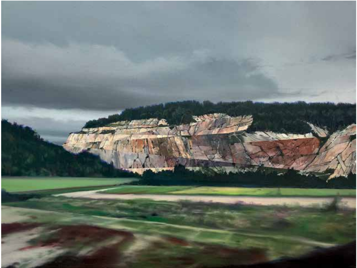
11 Steinbruch ZAD, Öl auf Leinwand, 46x61 cm, 2023