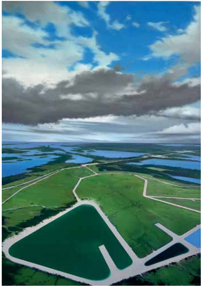
07 Kultplatz, Öl auf Leinwand, 100x70 cm, 2024