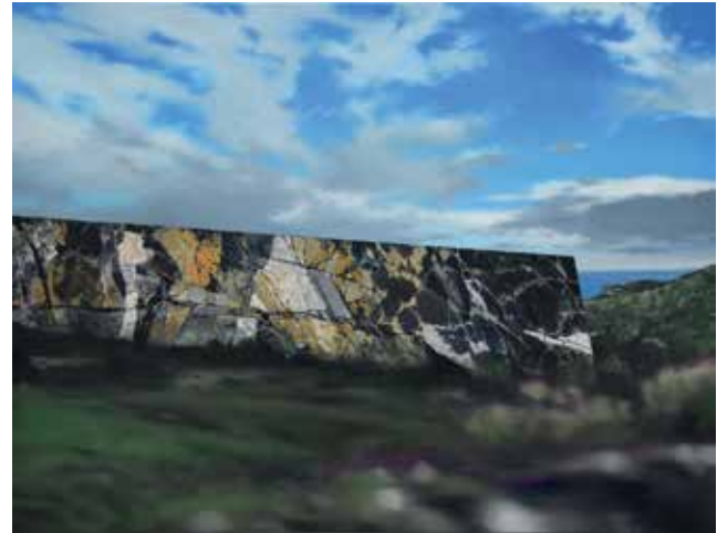
10 Um den See, Öl auf Leinwand, 46x61 cm, 2023 Riegelmonolith, Öl auf Leinwand, 46x61 cm, 2023