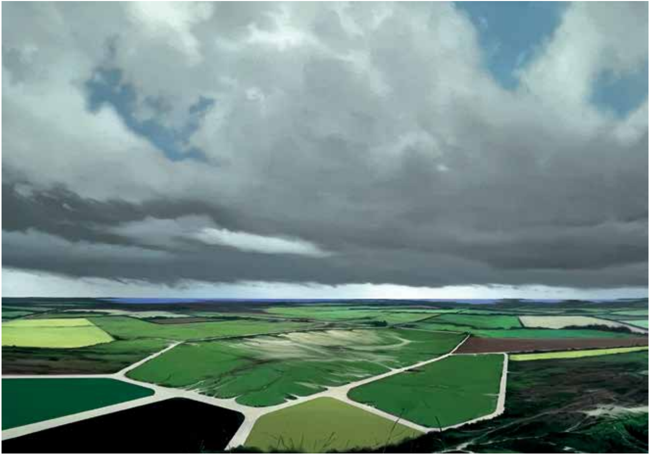
08 Evergreen, Öl auf Leinwand, 70x100 cm, 2024