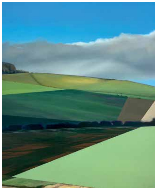
18 Roter Berg 2, Öl auf Leinwandstück, 29x21 cm, 2023 Albrechts Acker, Öl auf Leinwand, 70x50 cm, 2023