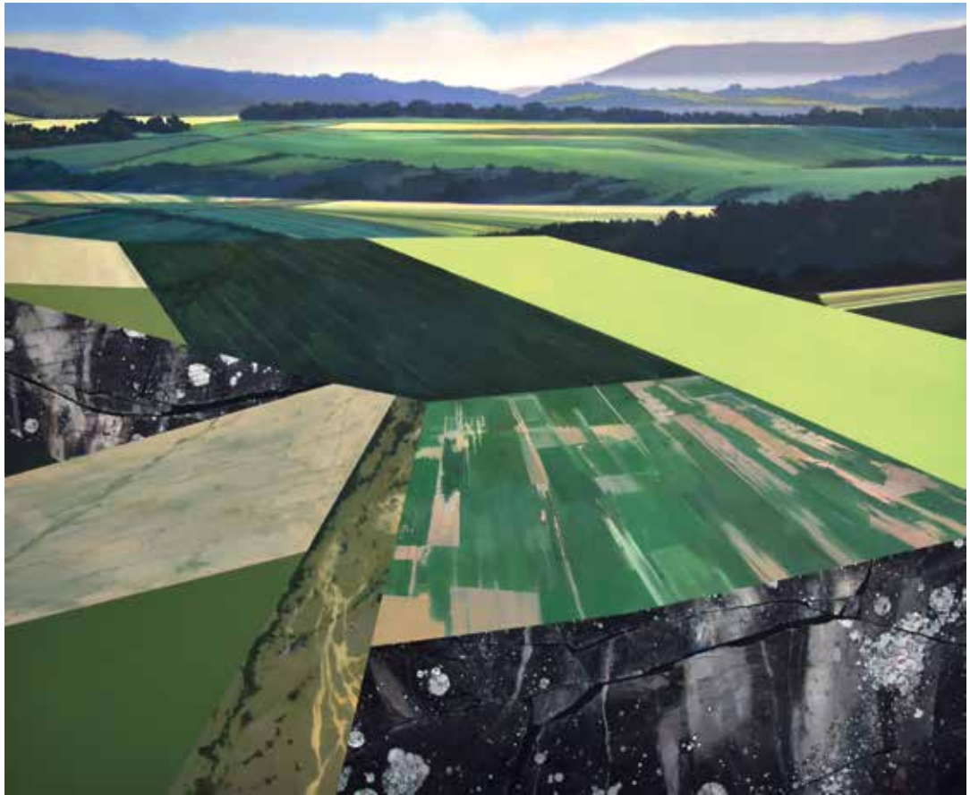
16 Monolithen und Dimensionen, Öl auf Leinwand, 140x170 cm, 2022